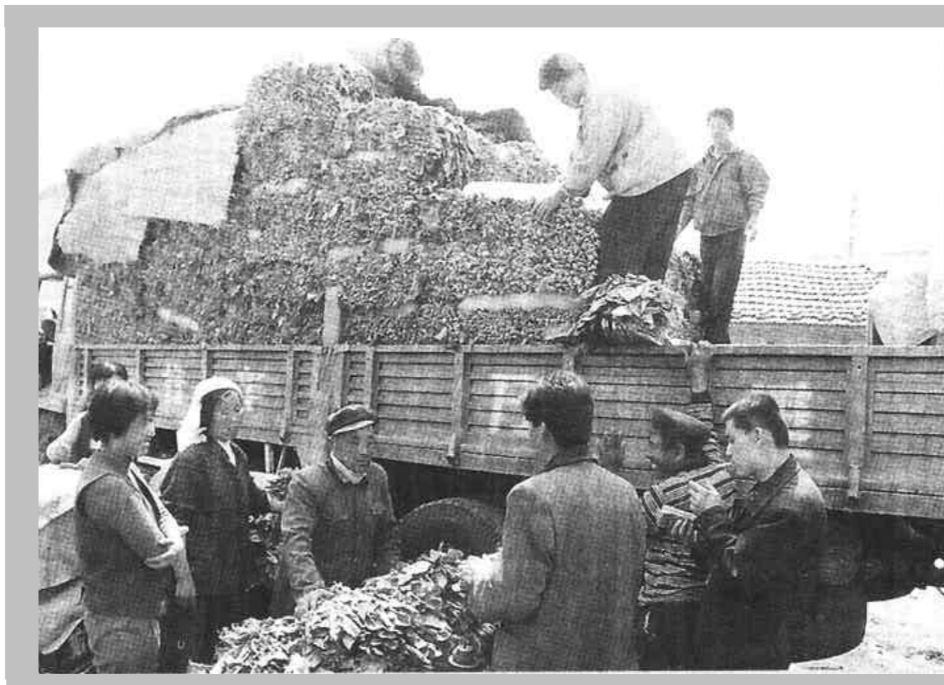
利津县北岭乡以市场为导向，大力推广绿色无公害蔬菜种植。目前，该乡蔬菜种植面积已达到22000亩，占耕地面积的60%强，年产各类蔬菜20万吨，远销黑龙江、吉林等地。图为黑龙江客户正在北岭乡收购蔬菜。

要选准路子，认真分析本地的自然资源、现有优势、开发潜力和市场行情，引导群众出主意、想办法，寻找集体经济多渠道发展的路子。二是要因地制宜，从实际出发，发挥本地的优势，积极发展投资少、见效快、易管理、风险小、市场硬的经济项目。三是要吸引外资，借